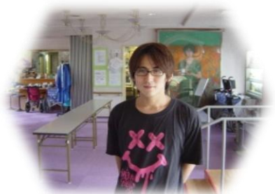
ユニットリーダー

私達は、自ら利用したいと思えるような施設作りを目指して日々取り組んでいます。目標にはまだまだ努力が必要です。高齢者が人生の最後まで穏やかに暮らせることを最大限に支えていきたいと思ひます。